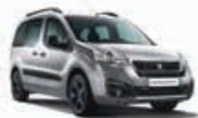
Серебристый металлик GRIS ALLUMINIUM ZRM0