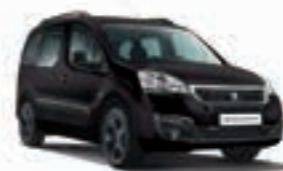
Черный металлик Noir Perla Nera 9VM0

Изображение автомобиля создано при определенных условиях. Цветовое восприятие изображений индивидуально и зависит от различных факторов, поэтому цвет автомобиля на изображении в данной брошюре может отличаться от цвета автомобиля Peugeot Partner Crossway, представленного в салоне официального дилера.