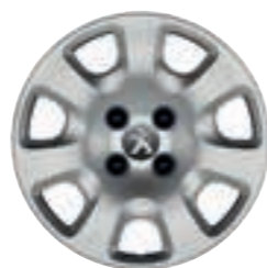
15" стальной диск