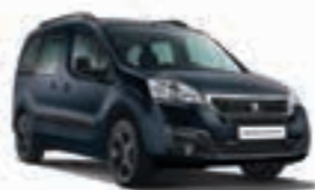
Синий металлик BLEU BOURRASQUE T4M0