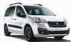
Белый акрил BLANC BANQUISE WPP0