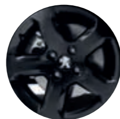
16" литой диск

PEUGEOT Partner Crossway оснащается штампованными дисками 15" или литыми 16", чтобы подчеркнуть его характер и индивидуальность.