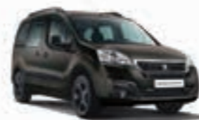
Коричневый металлик BROWN SQUIRELL JPM0