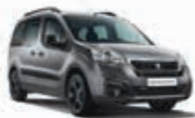
Серый металлик GRIS SHARK 9PM0